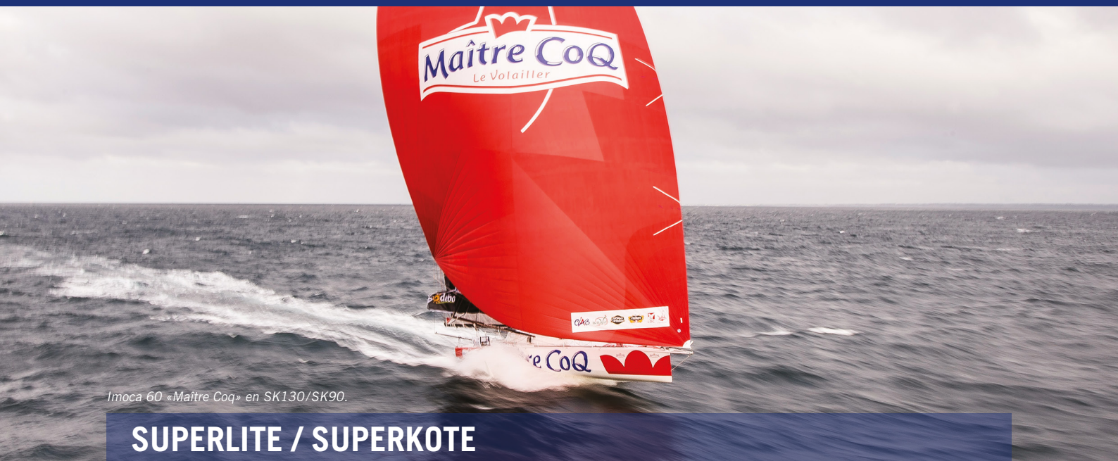
Imoca 60 «Maitre Coq» en SK130/SK90.